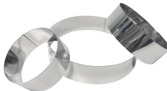
Ref. MA-INOX Molde aro inox