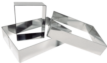
Ref. MR-INOX Molde rectangular inox