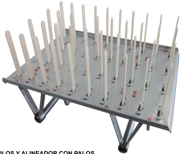
MOLDE PARA POLOS Y ALINEADOR CON PALOS Molde para fabricar 40 polos de diferentes medidas