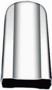
Ref. POLO 100ML Molde para fabricar polos de 100 ml. Inox