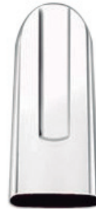
Ref. POLO 55ML Molde para fabricar polos de 55 ml. Inox