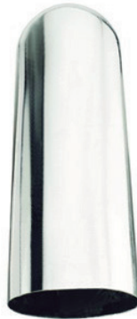
Ref. POLO 85ML Molde para fabricar polos de 85 ml. Inox