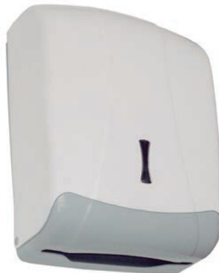
Ref. SLX-DP60BB Dispensador de Toallas ABS Blanco