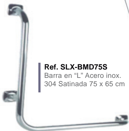
Ref. SLX-BMD75S Barra en "L" Acero inox. 304 Satinada 75 x 65 cm