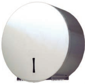
Ref. SLX-DP360B Portarrollo Higiénico Epoxi Blanco