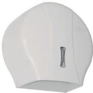
Ref. SLX-DP300B Portarrollo ABS Blanco