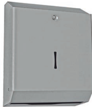
Ref. SLX-DP620E Dispensador de Toallas Epoxi Blanco