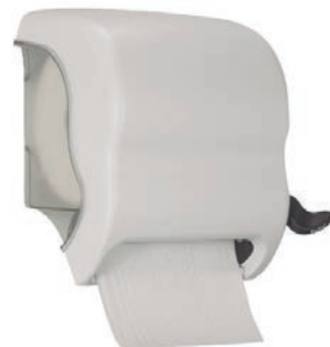
Ref. SLX-DP650M Dispensador Toallas en Rollo Palanca ergonómica