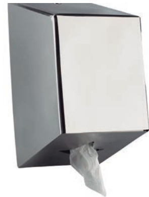
Ref. SLX-DP40IB Dispensador Mecha Inox. 304 Brillo