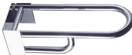
Ref. SLX-BMO08S Abatible inox. 304 Giro Vertical Satinado 81 cm