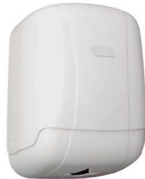
Ref. SLX-DP40BB Dispensador Mecha ABS Blanco