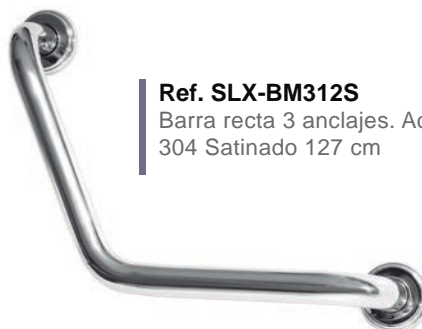
Ref. SLX-BM312S Barra recta 3 anclajes. Acero Inox. 304 Satinado 127 cm