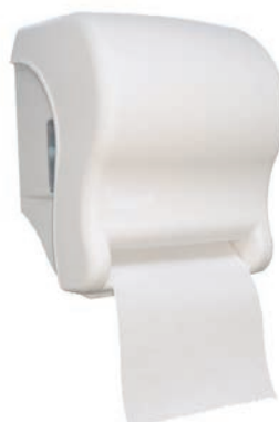
Ref. SLX-DP660A Dispensador Toallas en rollo Electrónico